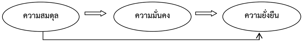
แผนภูมิที่ 2 ความสัมพันธ์ระหว่างองค์ประกอบในเป้าประสงค์ของปรัชญาของเศรษฐกิจพอเพียง

หลักการทรงงานต่างๆ ว่ามีความสัมพันธ์เป็นเหตุเป็นผลกันอย่างไร จึงทำให้การวิเคราะห์ขาดพลังของการพิจารณาเชิงองค์รวมที่รอบด้านอีกด้วย ความสัมพันธ์ดังกล่าวพิจารณาวิเคราะห์ได้จากแผนภูมิที่ 2 และ 3